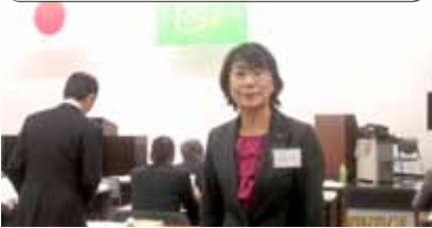
1/21 上田地域市町村議会議員研修会