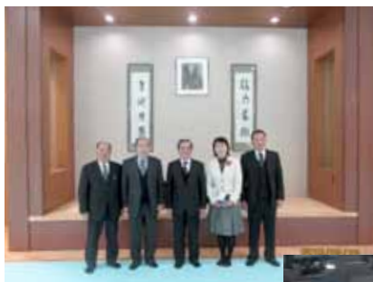
味の素ナショナルトレーニングセンターの柔道練習室にて

管理体制、利用料金及び利用状況、運営費の内容と負担方法、トレーニングの効果について、JOC強化チーム担当者から説明を受けました。