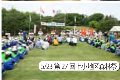
5/23 第 27 回上小地区森林祭