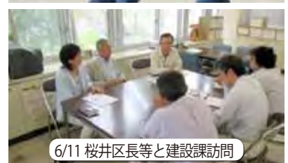
6/11 桜井区長等と建設課訪問