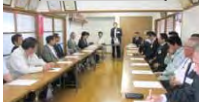
5/22 桜井区企業行政懇談会