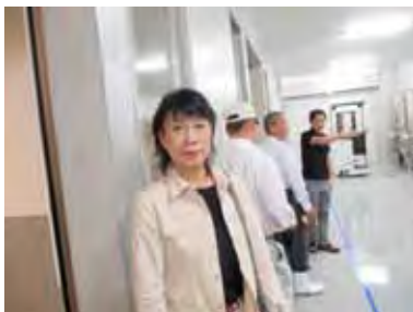
階下の醸造工場にて