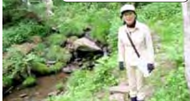
5/28 市有林調査・柵津奈良原