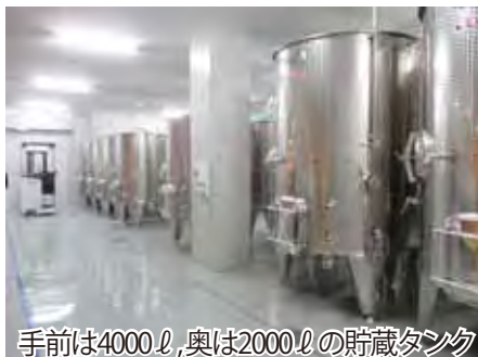
手前は4000ℓ,奥は2000ℓの貯蔵タンク