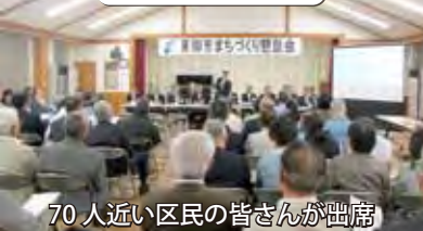
70 人近い区民の皆さんが出席