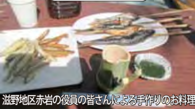
滋野地区赤岩の役員の皆さんによる手作りのお料理