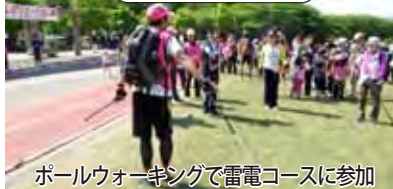
ポールウォーキングで雷電コースに参加