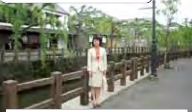
全国伝統的建造物群保存地区の千葉県香取市佐原町『柳暖簾』の街並みにて