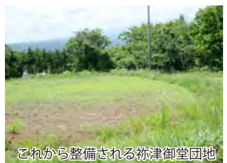
これから整備される柵津御堂団地