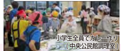
小学生全員でカレー作り (中央公民館調理室)