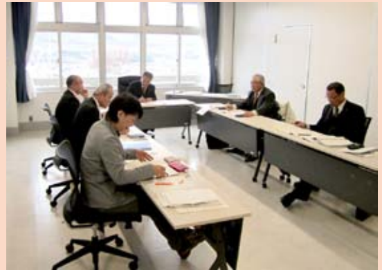
産業建設常任委員会の審議風景