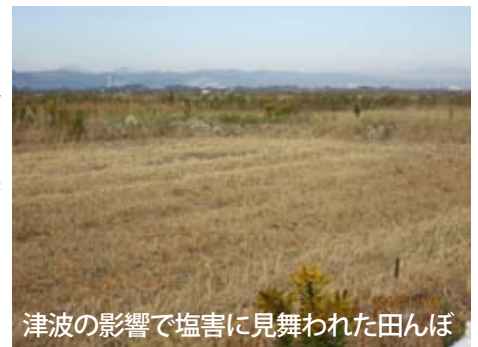
津波の影響で塩害に見舞われた田んぼ

仙台市の南に位する岩沼市の農業に関する東日本大震災からの復旧・復興に向けた取り組みを岩沼市役所にて説明を受け、農事組合法人で行っている水稻・大豆・キャベツ等の野菜栽培施設を視察、さらに津波により塩害となった農地や仮設集合住宅地を視察した。