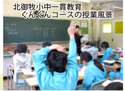
北御牧小中一貫教育 ぐんぐんコースの授業風景

平成 25 年度から北御牧小中学校対象に義務教育 9 年間の連続した教育課程の下で、小中一貫教育が進められており、学力向上・不登校児童生徒への対応対策に当たり、特色ある教育活動に取り組まれている。今後は東部中学校区での一貫教育について保護者や市民から期待の声も聴かれる中で、教育委員会の考えや現況を伺いたい。